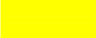
TABLE CUSTOMER / SUPPLIER