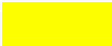
TABLE DELIVERYCUS / DELIVERYSUP